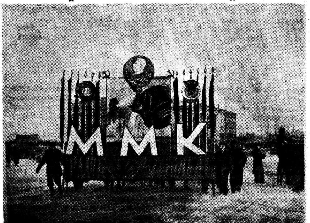
7 ноября 1952 года. Колонны металлургов нашего комбината проходят по Комсомольской площади.