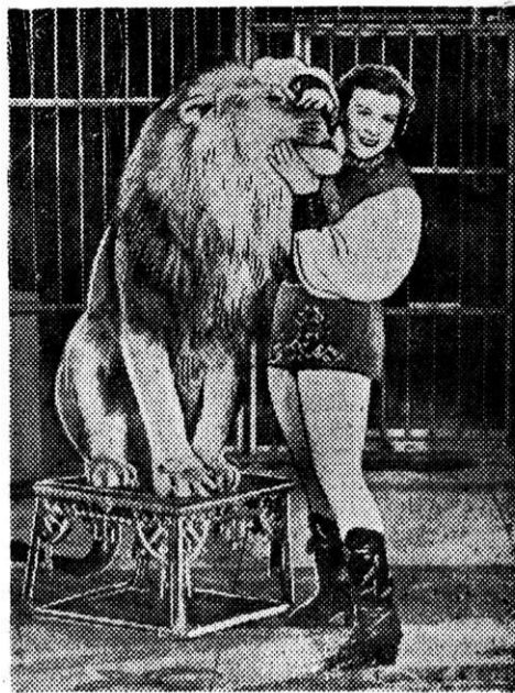
Цирк. Большой популярностью пользуются выступления укротительницы львов, Заслуженной артистки РСФСР Ирины Бугримовой. На снимке: Ирина Бугримова на арене цирка.