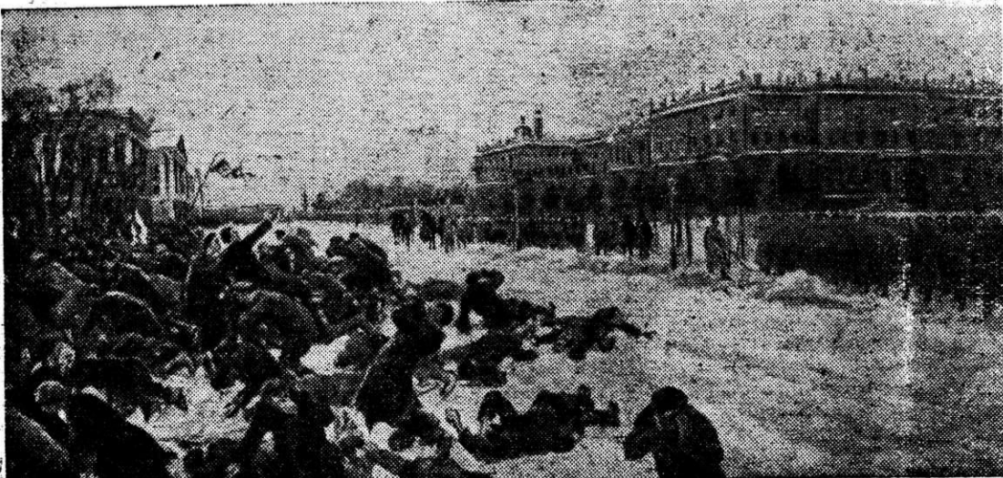
«Расстрел рабочих у Зимнего дворца 9 января 1905 г.» Репродукция с картины художника И. Владимировича.

ГОРТЕАТР им. ПУШКИНА: сегодня «Годы странствий», завтра «Сильные дуз*ом». В КИНОТЕАТРАХ «МАГНИТ», им. ГОРЬКОГО и «КОМСОМОЛЕЦ»: «Герои Шипки». ДВОРЕЦ КУЛЬТУРЫ МЕТАЛЛУРГОВ: 21, 22 и 23 января «Испытание верности».