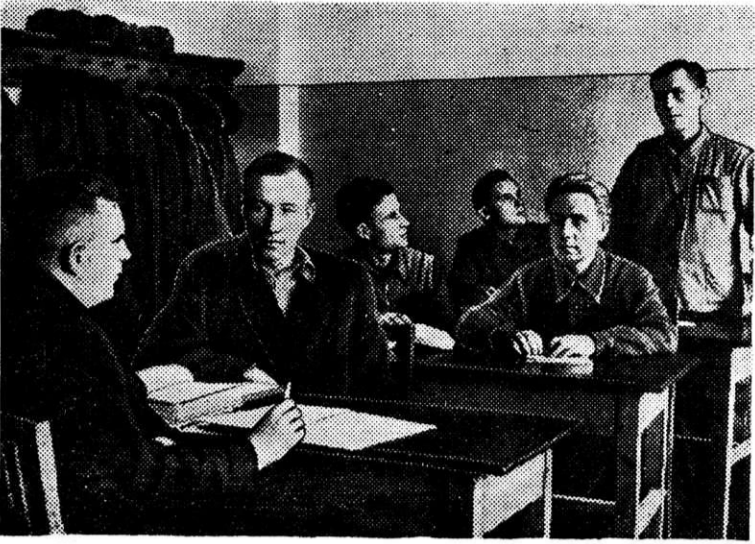
На снимке: занятие кружка по изучению политической экономии в обжимном цехе, которым руководит пропагандист В. И. Оглушевич.