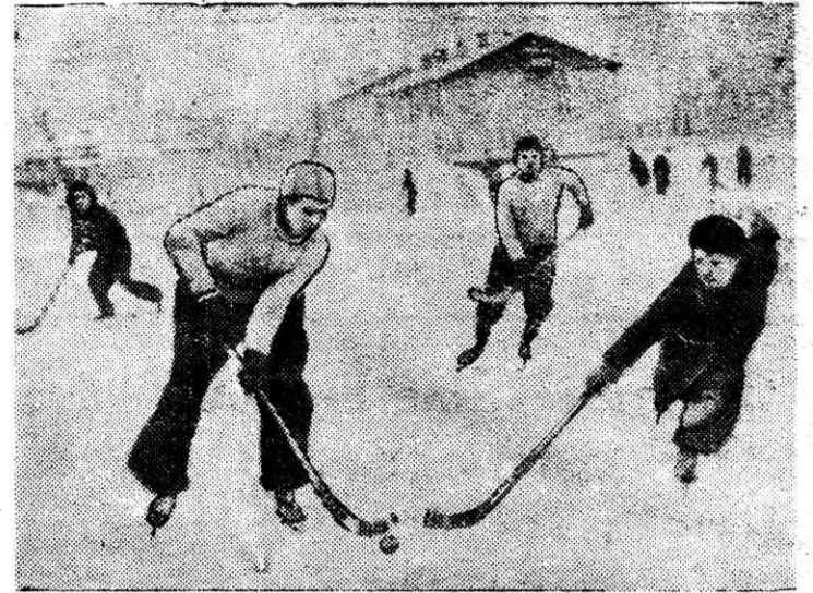
В прошлое воскресенье состоялась очередная встреча на первенство города по хоккею с мячом между командами «Металлург» и интерната. Игра закончилась со счетом 5:2 в пользу команды интерната. На снимке: момент игры хоккейных команд.