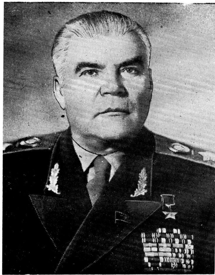
Кандидат в депутаты Верховного Совета СССР РОДИОН ЯКОВЛЕВИЧ МАЛИНОВСКИЙ

Все — на выборы! Товарищи избиратели! Все, как один, используем свое право выбирать депутатов в Верховный Совет СССР и единодушно отдадим свои голоса за кандидатов народного блока коммунистов и беспартийных.