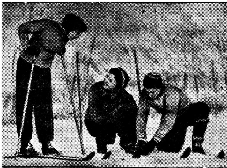
Случай на прогулке.