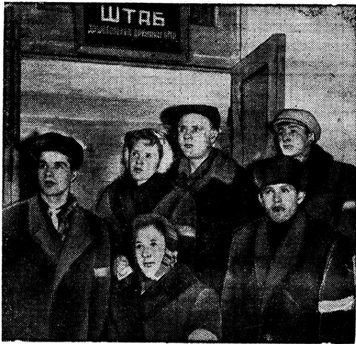
Дружинники основного механического цеха.