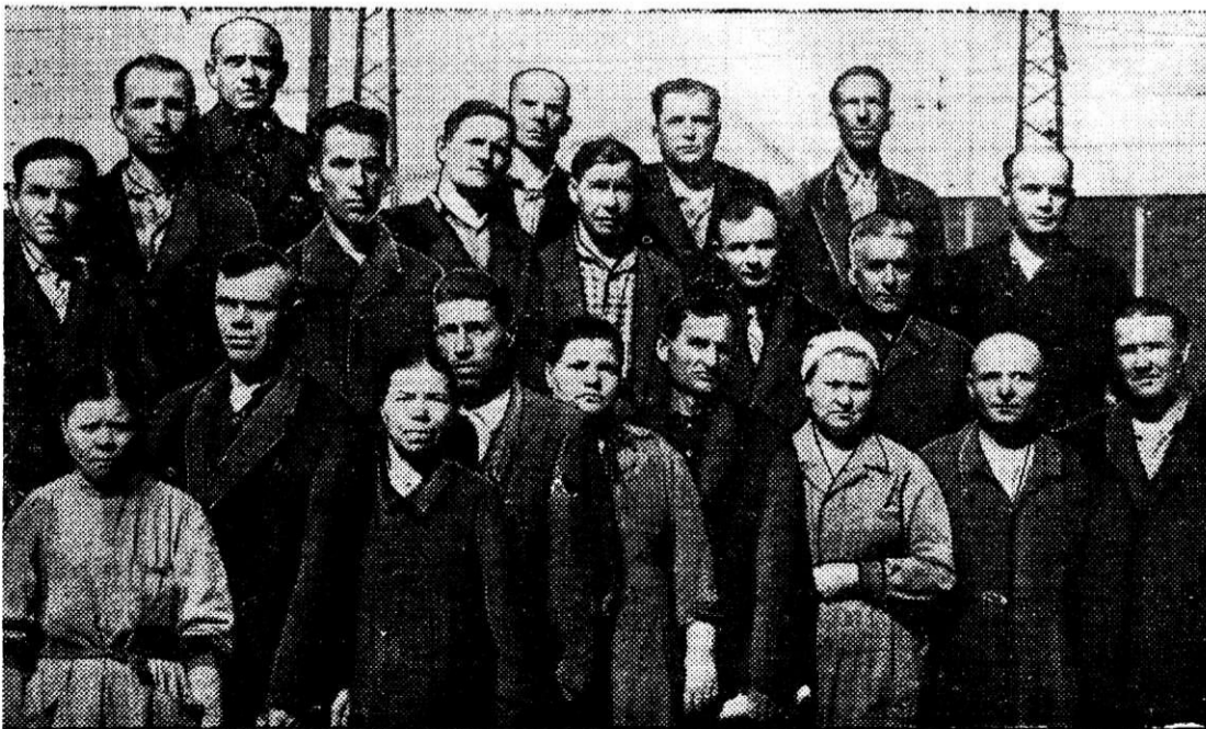
На снимке: ветераны фасонно-вальце-сталелитейного цеха. Они работают со дня пуска своего производства.

Около 40 юношей и девушек цеха занимаются в кружках художественной самодеятельности. В нынешнем году участники самодеятельности дали 15 концертов в подшефном Богдановском зерносовхозе Кизильского района, в пригородном совхозе «Поля орошения», во многих цехах комбината.