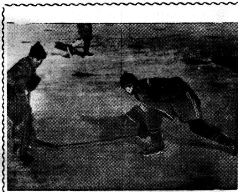
Хоккеисты листопрокатного цеха № 3 одержали верх над прокатчиками четвертого листопрокатного цеха. Игры продолжаются.

На снимке: момент встречи хоккеистов КИПа и основного механического цеха.