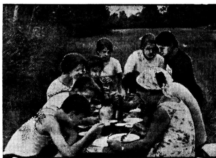
ТУРИСТИЧЕСКАЯ БАЗА. Вкусен обед на свежем воздухе.

Лодки не стоят без дела. Не успела одна группа подплыть к берегу, как лодку занимают уже другие отдыхающие. И снова она плывет по зеркальной глади Банного озера.