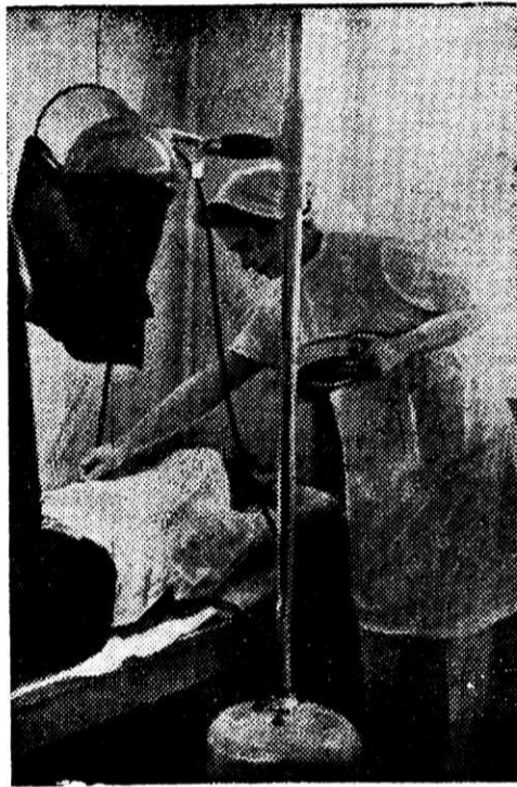
В физиотерапевтическом кабинете

Но где же русские березки? Идем по поселку. Многоквартирные дома, дачи с мезонинами, кругом обсаженные деревьями: тополь, яблоня. И