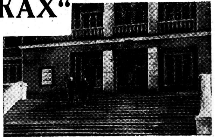
Главный вход в профилакторий