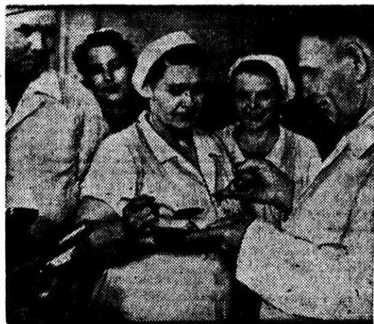
Первая проба. Хорош борщ, ребята будут довольны.