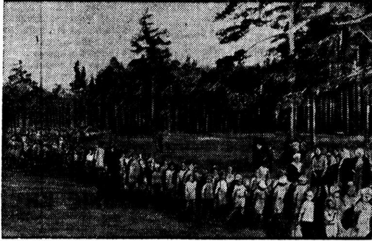
«Здравствуй, лагерь», — говорят дети.