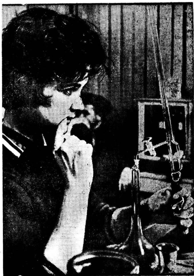
Где же ошибка?