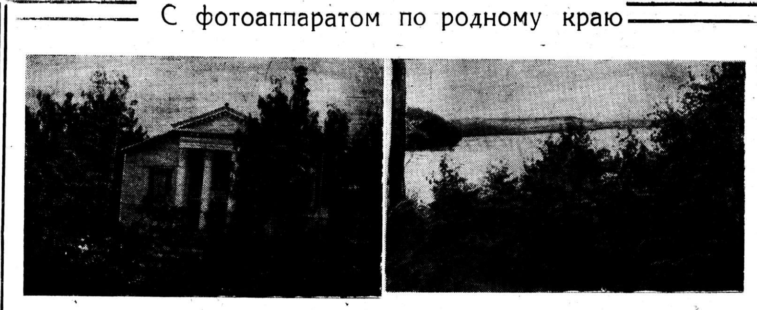
Озеро Еловое и дом отдыха этого же названия.

В магазины книготоргов поступили в продажу новые книги. А. Норолев «Прокатные станы и оборудование прокатных цехов» (атлас). М.: Металлургия 1963 г. ц. 3—12. Г. Арнулис «Совместная пластическая деформация разных металлов» М. Металлургия 1964 г. ц. 0—98. А. Д. Крамаров «Производство стали в электропечах», учебник для металлургических вузов. М. Металлургия 1964 г. ц. 1—11. В. С. Меськин «Основы легиро-