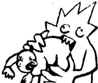
рис. Л. Демьянов