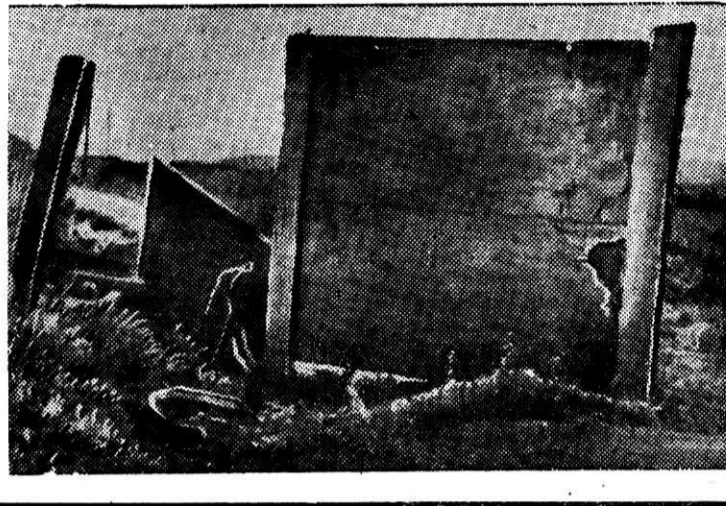
Фото и текст П. Серова.

Год 1965-й. Та же сторона забора и ничего нового, правда, и она не нова. Строители забыли ее закрепить и плиты разваливаются. Остальные столбы и плиты лежат поросшие бурьяном, обожженные солнцем, омытые дождями. Часть из них уже пришла в полную негодность.