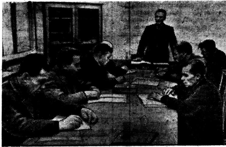
На снимке: идут занятия в начальной политшколе коксозимического производства.