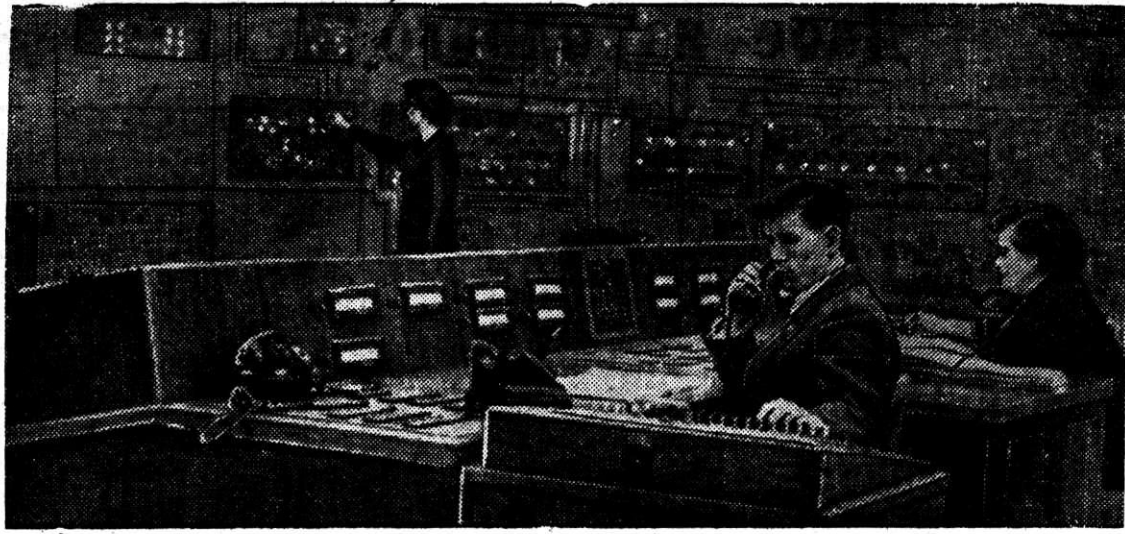
Диспетчерский пункт цеха электросети — сердце комбината. Тысячи нитей ведут отсюда ко всем подстанциям, и по команде, без вмешательства человека, может быть изменена схема питания любого района или цеха комбината.

Из наблюдений за отлетом и прилетом пернатых за то время, пока строится стадион, можно их возвращение в родные края предвидеть, если не за час, то за сутки, а вот, когда к работам вернуться строители, предугадать гораздо сложнее.