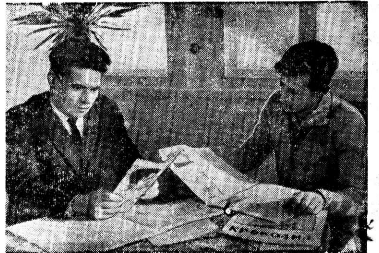
Прекрасно оборудованы библиотека и читальный зал ее в пансионате металлургов на Банном озере.