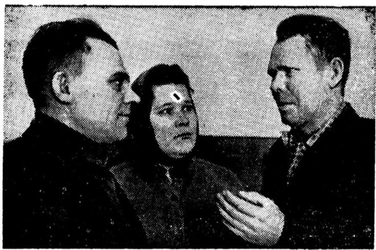
Много хороших специалистов работает в цехе подготовки составов.