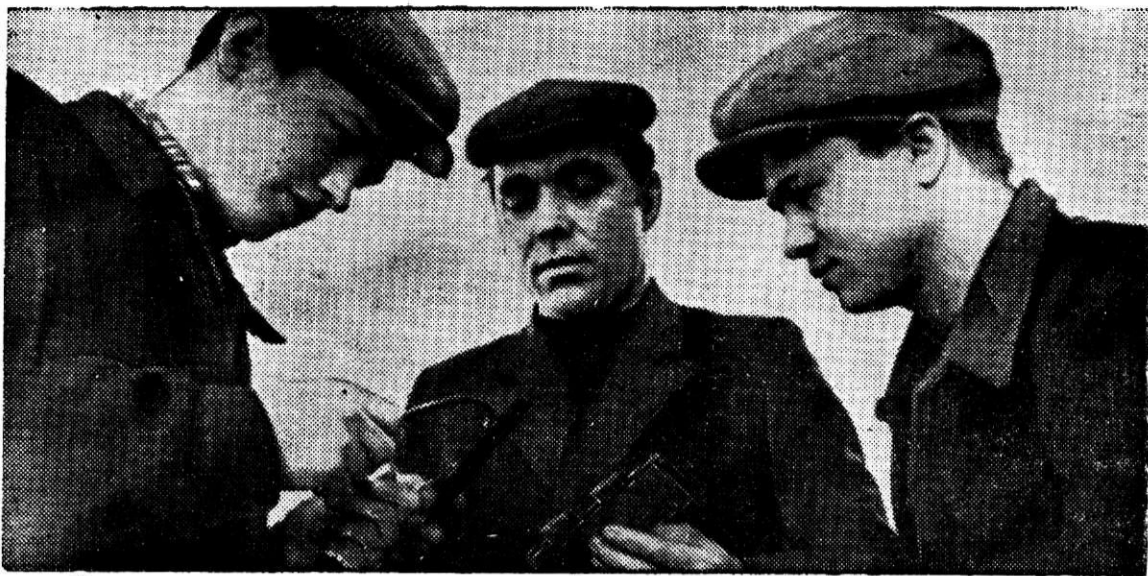
Сотни юношей и девушек города начинают свое знакомство с будущей специальностью в производственных мастерских, находящихся в цехах комбината.