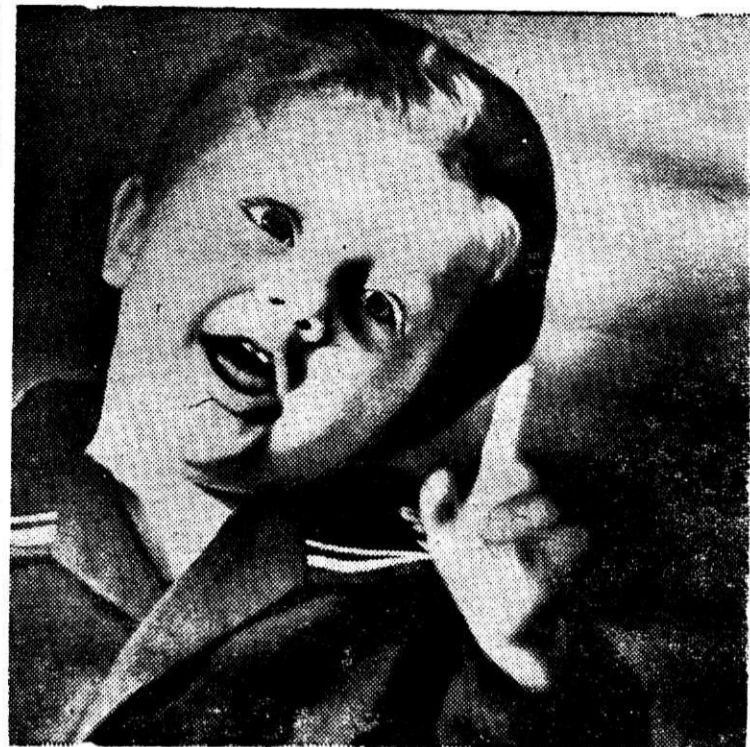
УХ, КАКОЙ ТЫ ХИТРЕНЬКИЙ!

Ведь я родился, живу на Урале, Там, где вода не морская. Наверно, в Сицилии, Или на Крите Кому-то уральские волны снятся И я по какому-то по наитию, Внезапден откликаться... Как бы там ни было, Среди морей, В средиземном просторе, Плещется, Плещется в жизни моей Средиземное море.