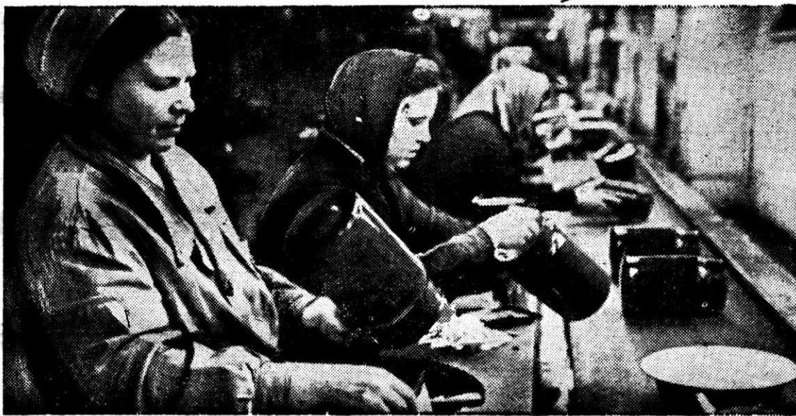
КОНВЕЙЕР ГОТОВОЙ ПРОДУКЦИИ.