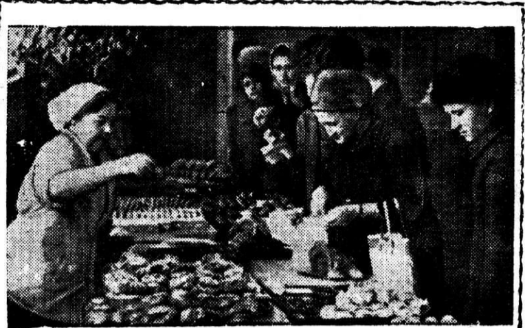
Каждую субботу работники столовой № 10 организуют выставку-продажу кулинарных изделий. Оживленно и многолюдно здесь в дни выставки.

— Мы очень рады, что живем и учимся у наших верных друзей в славном городе металла. Магнитогорцы повседневно проявляют к нам чувство братской дружбы и международной солидарности, — говорят посланцы дружественной Монголии.