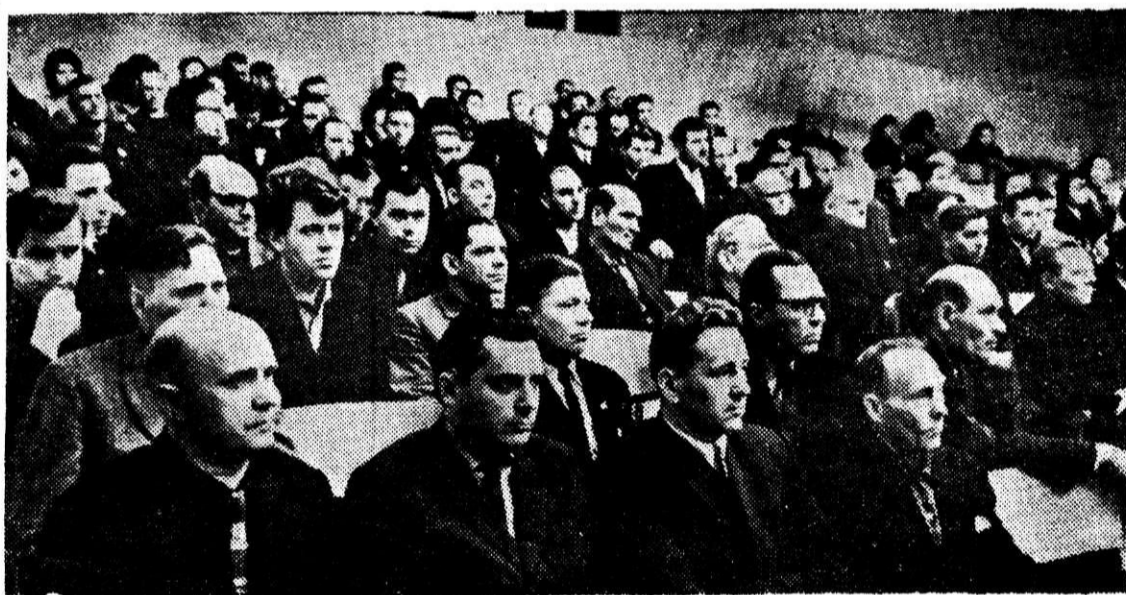
УЧАСТНИКИ ПЛЕНУМА В ЗАЛЕ ЗАСЕДАНИЯ

В интернатах комбината проживает много молодых рабочих. Здесь ведется большая воспитательная работа и видны ее положительные результаты. Среди работников, проживающих в интернатах, нарушителей трудовой дисциплины гораздо меньше.