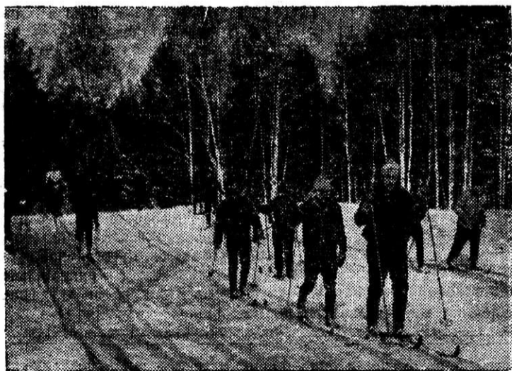
На последней лыжне сезона.