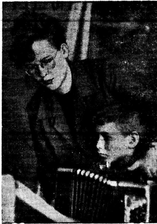
УРОК МУЗЫКИ.