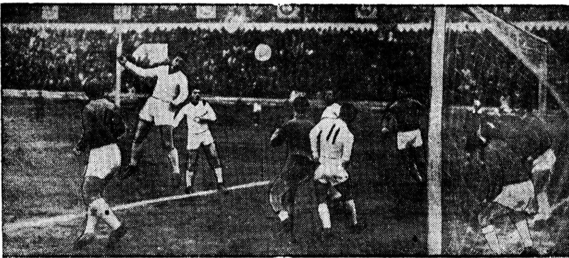
НА СНИМКЕ: один из острых моментов игры.