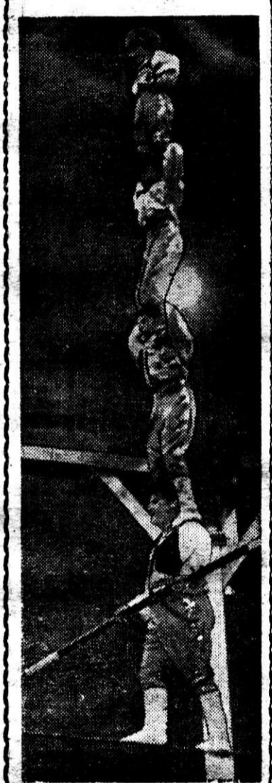
Магнитогорцы впервые встречаются с цирковыми артистами «Цовкра».

Труженики села поблагодарили своих шефов за большую помощь. В знак признательности и благодарности по хорошему русскому обычаю работники сельского хозяйства преподнесли магнитогорцам большой каравай из хлеба нового урожая.