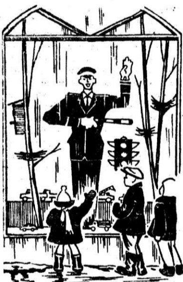
Здравствуй, Весна! Путь открыт!