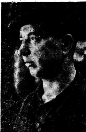
Фото и текст Н. Нестеренко.

В марте хороших производственных показателей на стане «4500» листопрокатного цеха добилась смена мастера С. А. Кудрицкого, выдавая много сверхпланового металла.