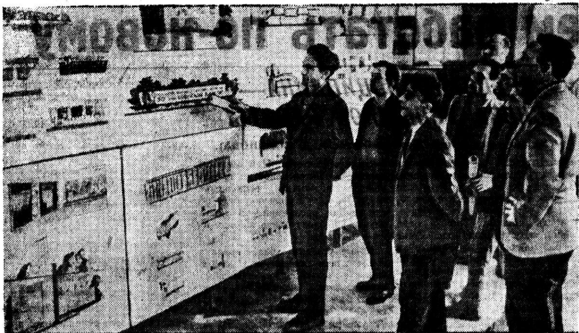
Каким будет нагрудный юбилейный значок, как будут выглядеть накануне праздника Великого Октября проходные комбината, фасады заводских и городских зданий, красные уголки и общественные помещения — на эти и многие другие вопросы дает ответ городская выставка эскизов наглядной агитации, которая проходит сейчас во Дворце строителей. НА СНИМКЕ: в одном из залов выставки.