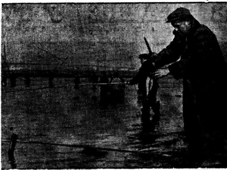
Вот оно, рыбацкое счастье!