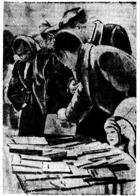
НА КНИЖНОМ БАЗАРЕ.

Когда верстался этот номер, пришло известие, что Указом Президиума Верховного Совета СССР Советское общество Красного Креста награждено орденом Ленина.