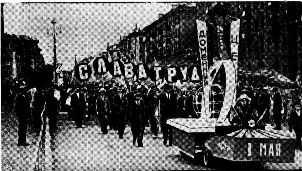
НА СНИМКЕ: Идет колонна трудящихся доменного цеха.

Вместе со всем советским народом магнитогорцы в этот день продемонстрировали неизменную солидарность с миролюбивыми народами мира, со всеми людьми труда, преданность делу нашей партии и правительства.