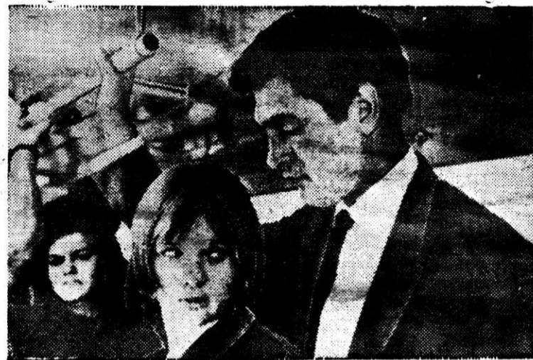
Кадр из фильма «Журналист». На V Московском международном кинофестивале ему был присужден «Большой приз».