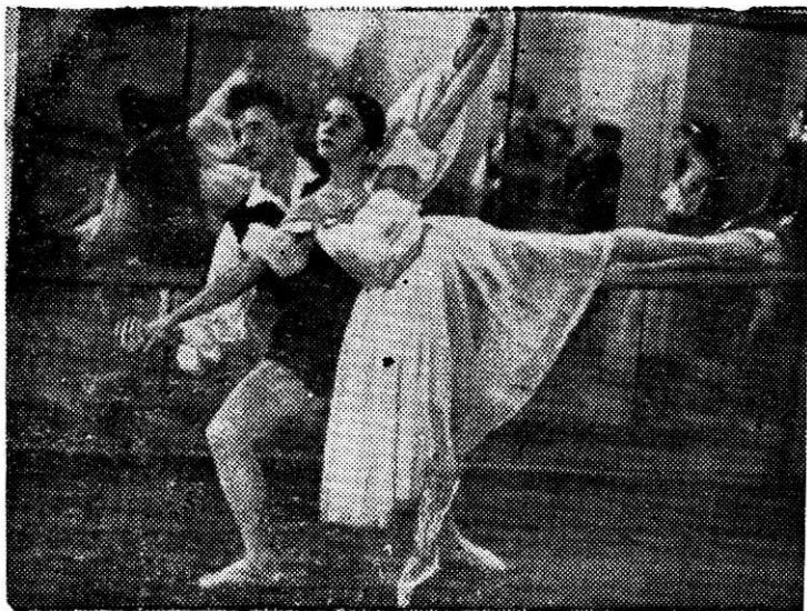
...растет мастерство отдельных исполнителей.