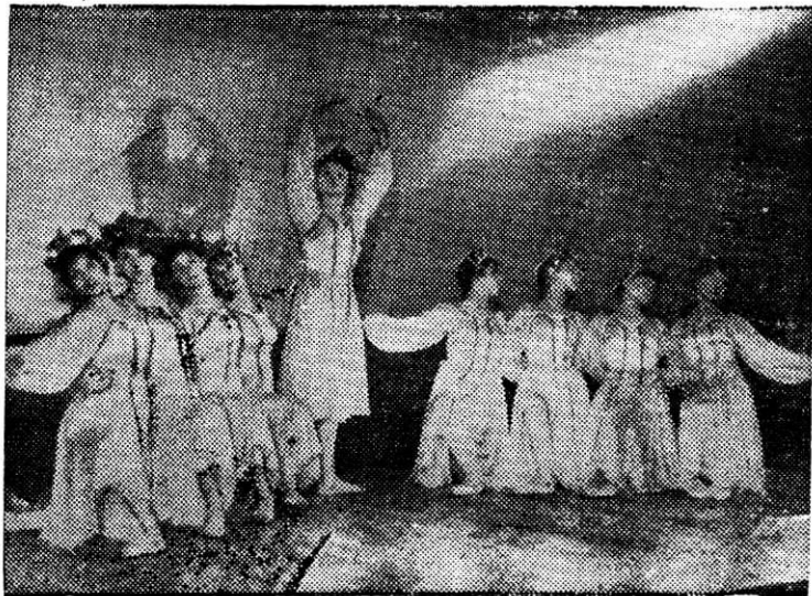
...на смену выбывшим приходит новое пополнение.