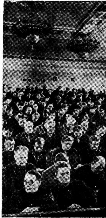
Для тружеников комбината, занимающихся в сети партийного просвещения, начались дни напряженной учебы. В минувший понедельник в актовом зале ЦЗЛ состоялось объединенное занятие слушателей школ основ марксизма-ленинизма четвертого года обучения.

НА СНИМКЕ: Слушатели на лекции.