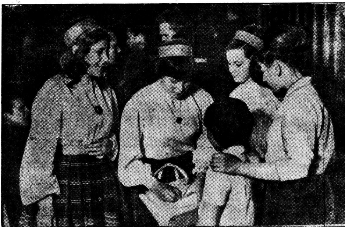
Делегаты слета училищ профтехобразования дают автограф юным магнитогорцам.