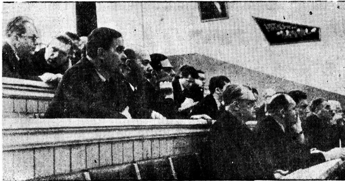
Тысячи трудящихся комбината повышают свои знания в институтах, техникумах, школах, на различных курсах и в сети партийного и комсомольского просвещения.

На снимке: занятие на факультете науки и техники Ленинского университета знаний.