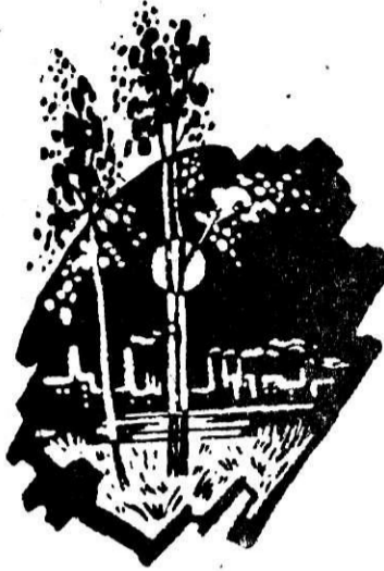
Рисунки П. ХНЫКИНА

Мой край родной, где трубы, как зенитки, спокойно в небо синее глядят, на трудовом посту стоит Магнитка, как на посту своем стоит солдат.