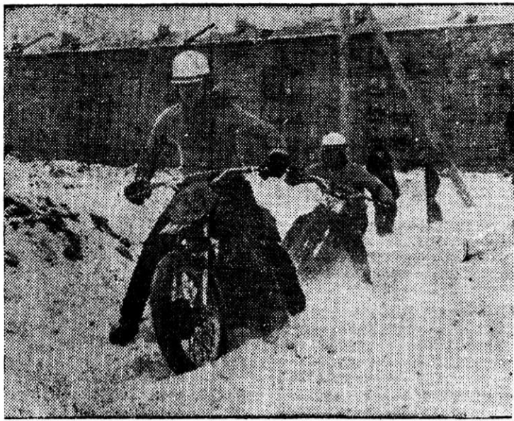
НА СНЕЖНОЙ ТРАССЕ.

М. ГОЛЛАНД, пенсионер, наш нештатный корреспондент. И. КРУЧИНИНА.