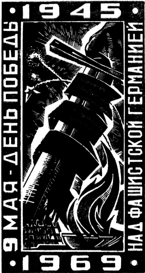
Плакат П. ХЫРИНА.