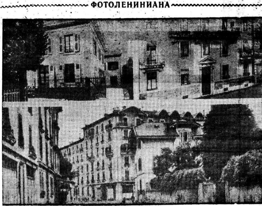
13. ЖЕНЕВА. Слева сверху — дом, в котором жил В. И. Ленин в 1903—1904 годах. Внизу — улица Давид-Дюфур и дом (слева), в котором жил и работал В. И. Ленин в 1904 году. Справа сверху — дом по улице Маришес № 61, где жил В. И. Ленин в начале 1908 года.