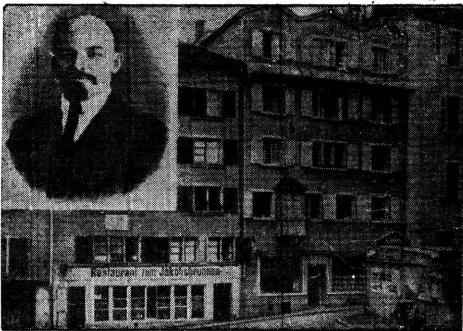
21. ЦЮРИХ (Швейцария).

Дом по улице Шпигельгассе № 12, где жил В. И. Ленин с 21 февраля 1916 года по 2 апреля 1917 года.