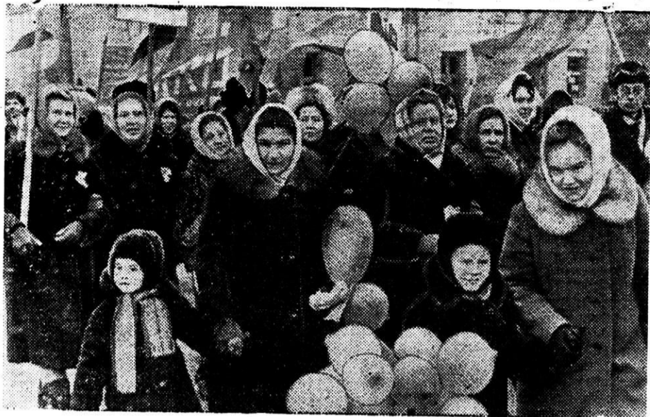
Праздничная демонстрация трудящихся Магнитогорска.