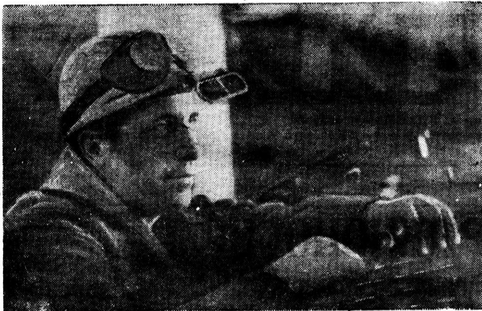
Труд коллектива нашего комбината в восьмой пятилетке высоко оценен правительством и отмечен высокой наградой — орденом Ленина. К числу коллективов, успешно справившихся с заданием пятилетнего плана, относится и комсомольско-молодежный коллектив тридцать пятой мартеновской печи.

На собрании было принято Письмо Центральному Комитету КПСС и Президиуму Верховного Совета СССР. Все стремления, мысли и чувства представителей нашего комбината, выступивших и не выступивших на митингах в цехах, на торжественном собрании во Дворце культуры, — сконцентрированы в этом Письме.