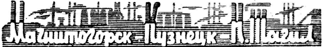
Итоги выполнения производственного плана за февраль и с начала 1971 года по Магнитогорскому, Кузнецкому и Нижнетагильскому металлургическим комбинатам (в процентах)

Искусными поварами будут приготовлены всевозможные блюда для дегустации. От опытных поваров, кулинаров можно будет получить рецепты приготовления этих блюд. Словом, все для вас будет в этот вечер, дорогие женщины. Добро пожаловать на слет, посвященный Международному женскому дню 8 Марта!