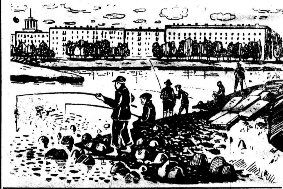
Рис. П. Хныкина.

Ну, а те, кого манит рыбалка, проводят время у заводского пруда.