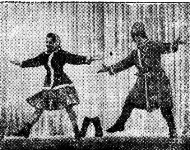
Сотни металлургов занимаются художественной самодеятельностью во Дворцах и клубах, у себя в цехе. На снимке: участники танцевального кружка левобережного Дворца культуры металлургов исполняют русский народный шуточный танец «Валенки».

Здесь я вырос, здесь светлой зарей моя юность в труде расцвела. Здесь свое сокровенное счастье создавал я с шестнадцати лет... Может быть, и мое есть участие в межпланетных полетах ракет. Где бы я был я, не знаю покоя — вижу цех свой, кпение работ... Знать, навеки желанной судьбой стал для жизни любимый завод. По привычке своей год от году, словно счастье боясь потерять, ранним утром спешу я к заводу, тороплюсь от других не отстать.