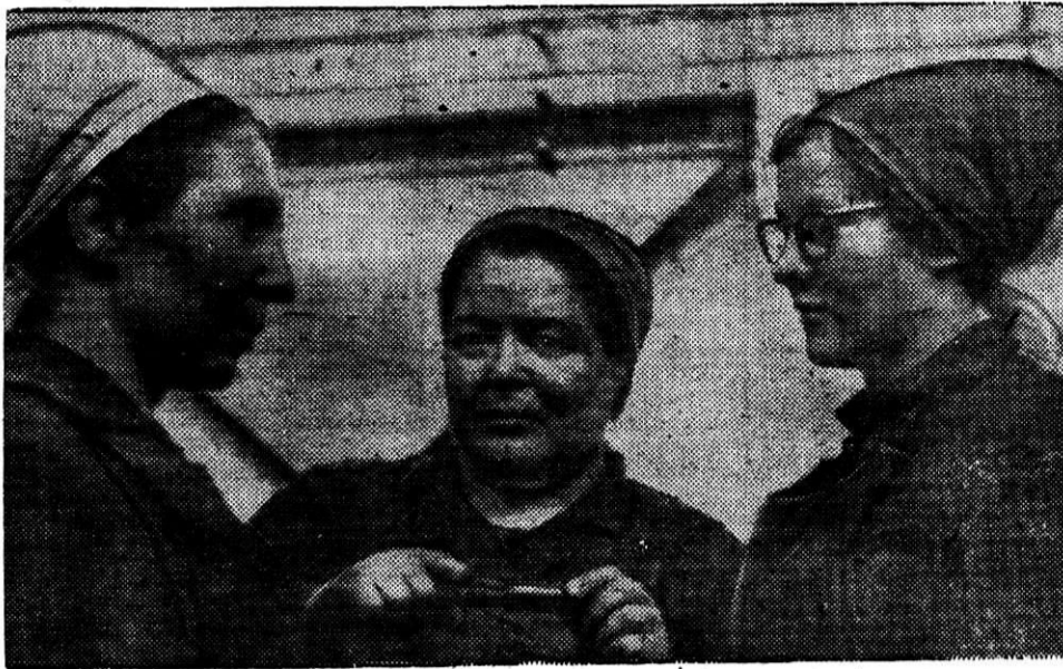
Большую роль в выпуске качественной продукции потребителям играют контролеры ОТК.