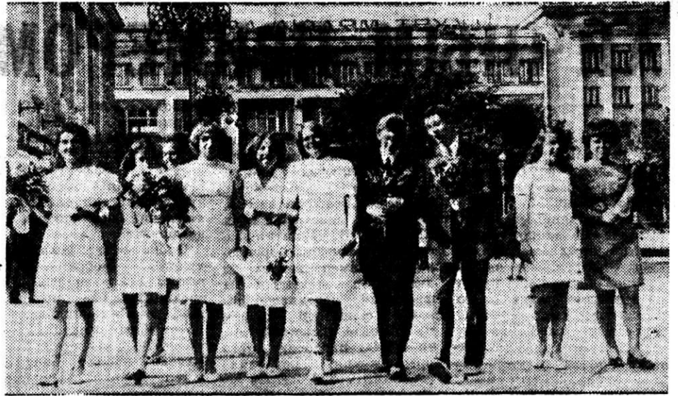
Закончился учебный год в школах, а для десятиклассников — учеба в школе. Часть юношей и девушек, получивших аттестат о среднем образовании, пойдут учиться в высшие и средние специальные заведения, после окончания которых станут врачами, металлургами, летчиками. Ну а многие пойдут работать на производство и, кто знает, может быть через несколько лет о них будут говорить как о передовиках и новаторах, имена их будут знать во всех уголках нашей страны. Счастливых вам дорог, молодые!

На снимке: группа выпускников школы № 8.