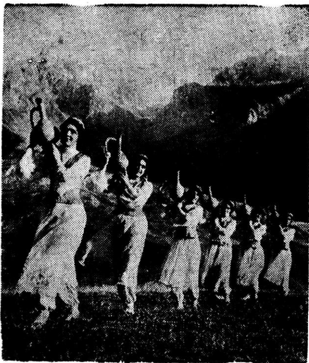
● НАВСТРЕЧУ 50-ЛЕТИЮ СССР ПО СТРАНЕ СОВЕТОВ Таджикская ССР. Самодеятельный ансамбль народного танца «Памир» при Хоргоском Доме культуры. На снимке: танец с кувшинами.