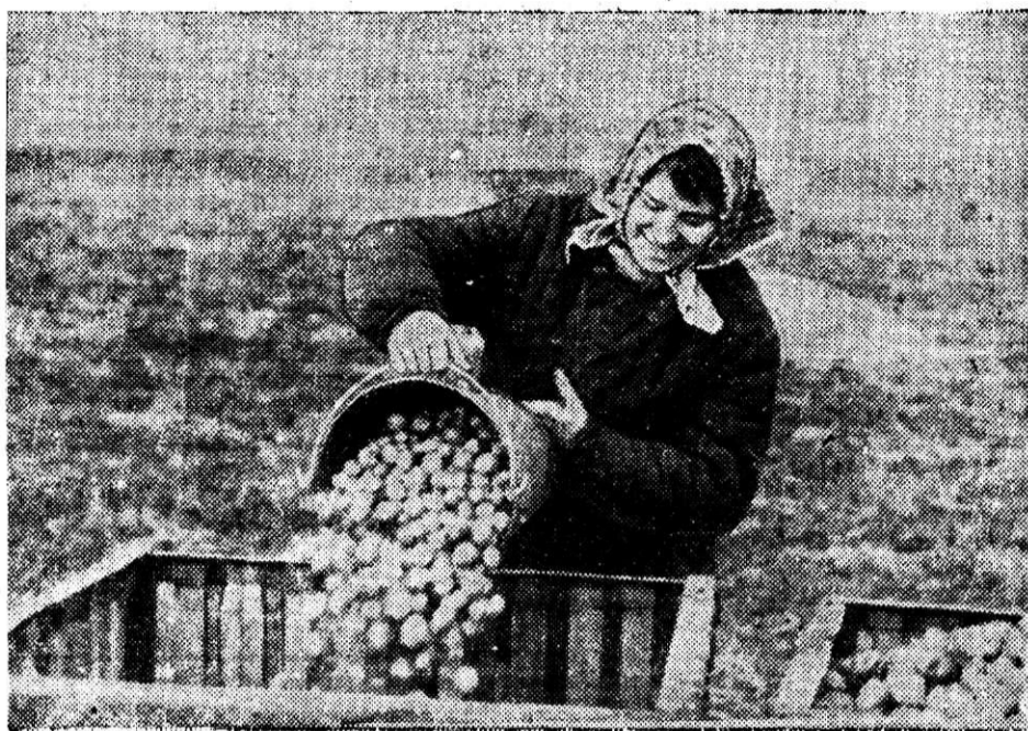
Труженицы цеха технологической диспетчеризации выезжали в Молочно-овощной совхоз на уборку картофеля. На картофельном поле и сделал эти снимки работник ЦТД Н. Зайцев.