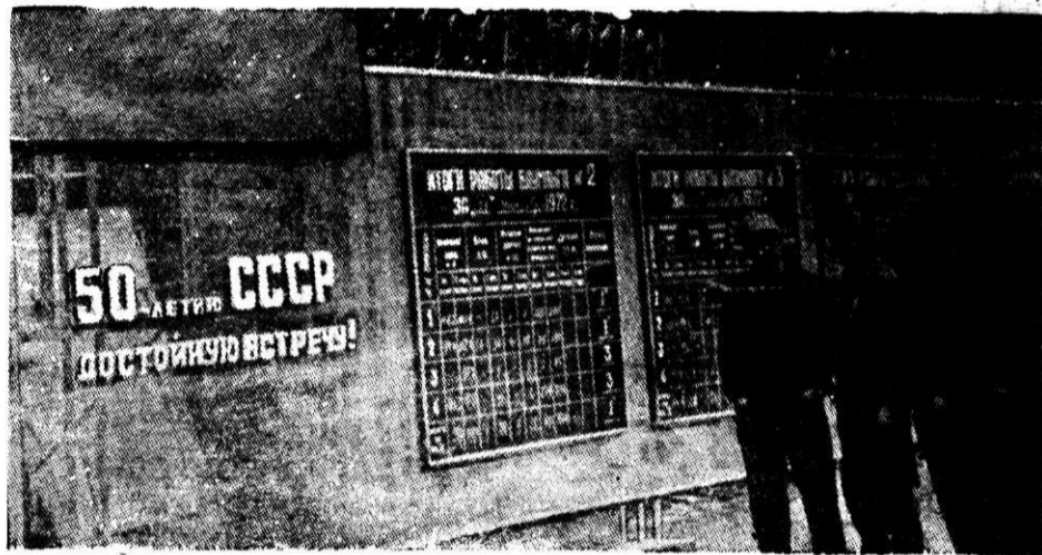
НА СНИМКЕ: трудящиеся первого обжимного цеха у стенда показателей работы бригад и участков в соревновании за достойную встречу 50-летия СССР.