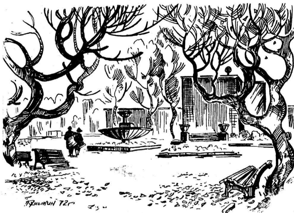
ОСЕНЬ В ПАРКЕ.

Белый день, бесконечно высокий... Вот он, мой незабвенный предел — голубые стрекозы в осоке, плавунцы на зеркальной воде. Пряный запах душицы и мяты... Я еще не пойму до сих пор, отчего ты такой необъятный в окружении крапивоносных гор. И с какой-то особой охотой, только лишь отойду от огня, неприметные прежде красоты налетают, давась, на меня. Ты умеешь калить меня сталью, и легенду открыть не одну, самой малой, невзрачной деталью, потревожить на всю глубину. Оступлюсь, ошибусь ли порою, иль в сомненьях запутаюсь лишь — ты не вскинешь седой головою, ты с укором мне в душу глядишь. Я с тобой силен и уверен, и бываю счастливейшим в дым, когда шаг мой с твоим соразмерен, когда сердце созвучно с твоим.