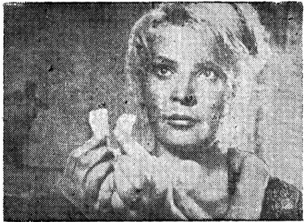
Кадр из фильма «Мачеха».

мов о молодежи не случайно. Будущая неделя — преддверие дня рождения комсомола, и кинотеатры города посвящают ее молодежи. Наряду с художественными фильмами на будущей неделе будут демонстрироваться и документальные фильмы о комсомольцах и молодежи нашей страны.